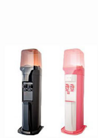
ウォーターサーバー

ご提案商材は誰もが知っている大手事業者の通信サービスや、生活必需商品など一般認知度が高い商品です。