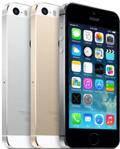
携帯電話 スマートフォン